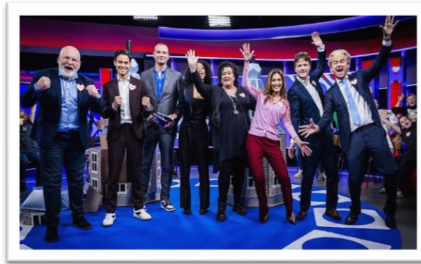
Enthousiast de verkiezingen in

De naam 'The Day After' de naam van een film uit 1983 over een nucleaire oorlog vind ik een pakkende titel voor donderdag 23 november, de dag na de verkiezingen. In de film gaat het om de dag na een strijd met nucleaire wapens, een dag met nagenoeg uitsluitend chaos.