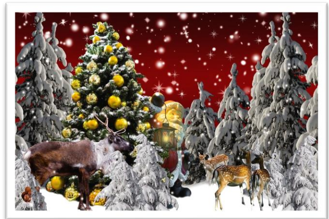
Fijne feestdagen en een goede start voor 2024

Nu gaan we even een rustige en feestelijke periode tegemoet. Een periode van bezinning en even tot rust komen, zodat we met een volgeladen accu in 2024 van start kunnen gaan.