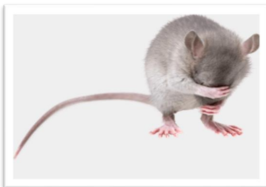
Deze muis past niet door luizengaatje

Het handelen van de medewerker, het zich zodanig gedragen dat een dreigende en gevaarlijke situatie ontstond voor hem en zijn collega's en alle mensen die zich in het pand bevonden, was terecht aangemerkt als ernstig verwijtbaar handelen. De situatie deed zich voor op het moment dat de medewerker alleen een gesprek moest voeren tegenover de werkgever, vertegenwoordigd door drie medewerkers. Gezien het feit dat de werkgever ook het nodige te verwijten viel, de psychische gesteldheid van de medewerker tijdens voormeld gesprek, wat hem bracht tot zijn daad. Was het in de ogen van de rechter niet redelijk en billijk om de medewerker de transitievergoeding te ontszeggen.