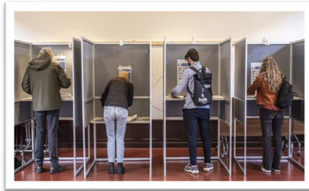
Ondanks lagere opkomst toch volle hokjes

Dit overziende denk ik dat Dilan Yeşilgöz-Zegerius, de lijsttrekker van de VVD wel een punt heeft met haar opmerking 'wij hebben niet goed geluisterd naar de kiezers'. Die opmerking geldt mijns inziens voor alle partijen. Het lijkt een déjà vu met de opkomst van Pim Fortuyn, toen ook pijnlijk zichtbaar werd dat menig Nederlandse kiezer zich niet of onvoldoende gehoord voelde door de grote partijen. Overal ontstonden lokale partijen, want die staan dicht bij de bevolking en weten wat er lokaal speelt.